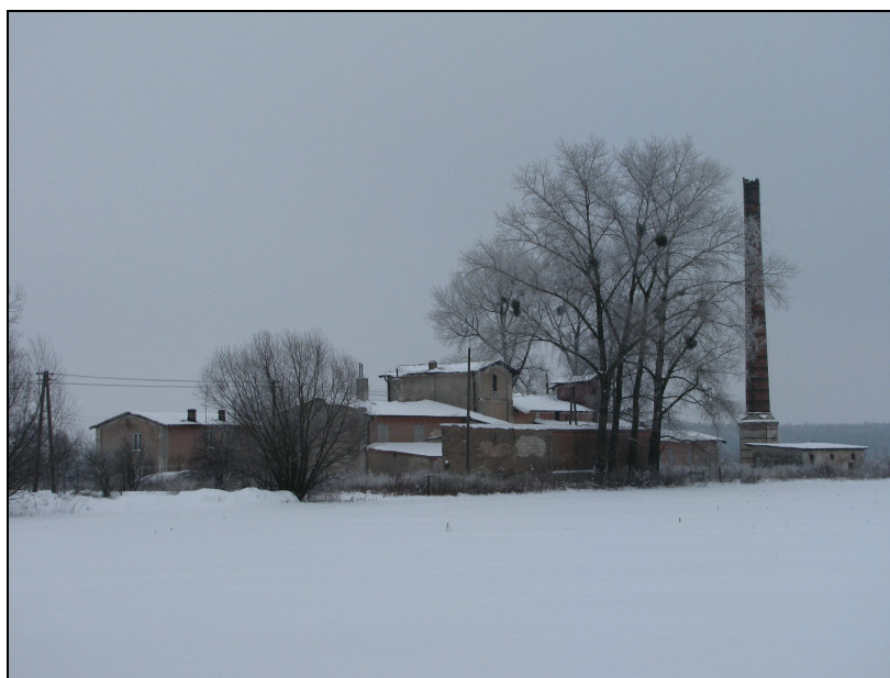
Fot. Budynek gorzelni w Radzyminie

W miejscowości Radzymin znajduje się, wpisany do rejestru zabytków, budynek gorzelni wraz z murem z pocz. XX wieku, a także, usytuowane 600 m na wschód od kościoła parafialnego i na południe od Strugi, stożkowate grodzisko zwane Kopcem z XII-XIV wieku.