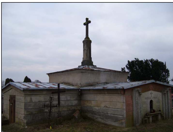
Fot. Mogiła powstańców polskich

Historia pozostawiła również swój ślad na cmentarzu parafialnym. Jest tam mogiła powstańców.