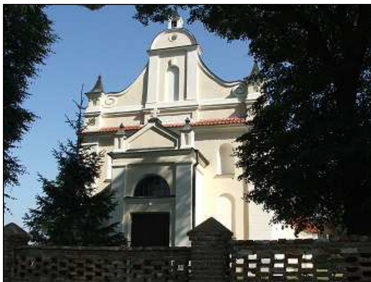
Fot. Kościół pw. Apostołów Piotra i Pawła w Radzyminie

Radzymin zasługuje na uwagę ze względu na niezwykłą historię kościoła parafialnego pod wezwaniem Apostołów Piotra i Pawła. Parafia powstała w drugiej połowie XIV wieku (około 1390 roku), erygowana przez bpa Ścibora z Radzymina. Na miejscu dotychczasowego