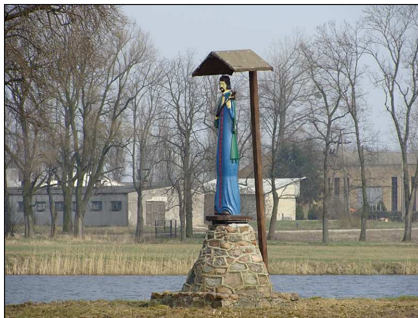
Fot. Figurka Św. Jana Nepomucena w Nacpolsku

Na wyspie stawu w Nacpolsku znajduje się figurka św. Jana Nepomucena. Pierwsza oryginalna figurka powstała w pierwszej połowie XIX wieku. Zginęła podczas renowacji około 2003 roku. Na jej miejscu wzniesiono nową w 2009 roku.