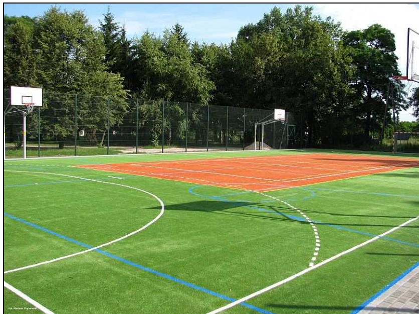
Fot. Ogólnodostępne, wielofunkcyjne boisko sportowe w Nacpolsku

Stan techniczny i funkcjonalność budynku Zespołu Szkół w Nacpolsku należy uznać za zadowalający, co jest rezultatem stałych, znacznych nakładów finansowych czynionych od kilku lat. W ostatnim czasie wybudowano ogólnodostępne, wielofunkcyjne boisko sportowe, wyposażono plac zabaw dla dzieci z klas 0 – IV oraz wymieniono oświetlenia w 7 klasach lekcyjnych.