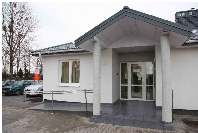
Fot. Mazowiecki Bank Spółdzielczy w Łomiankach Filia w Nacpolsku

Oprócz Urzędu Poczтового w miejscowości Nacpolsk znajduje się oddział Mazowieckiego Banku Spółdzielczego. Filia w Nacpolsku prowadziła działalność już od 24 października 2005 roku, ale w wynajętym lokalu. 2 grudnia 2009 roku nastąpiło uroczyste otwarcie Filii w Nacpolsku Oddział Naruszewo Mazowieckiego Banku Spółdzielczego w Łomiankach w nowym własnym lokalu. Bank w Nacpolsku oferuje usługi finansowe w zakresie lokat, kont oraz kredytów.