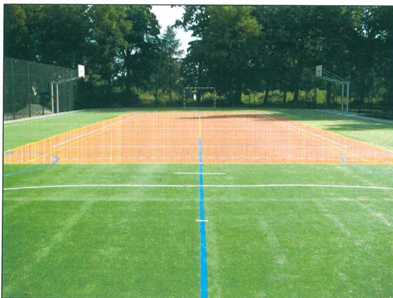
Rycina 5. Boiska wielofunkcyjne w Nacpolsku.