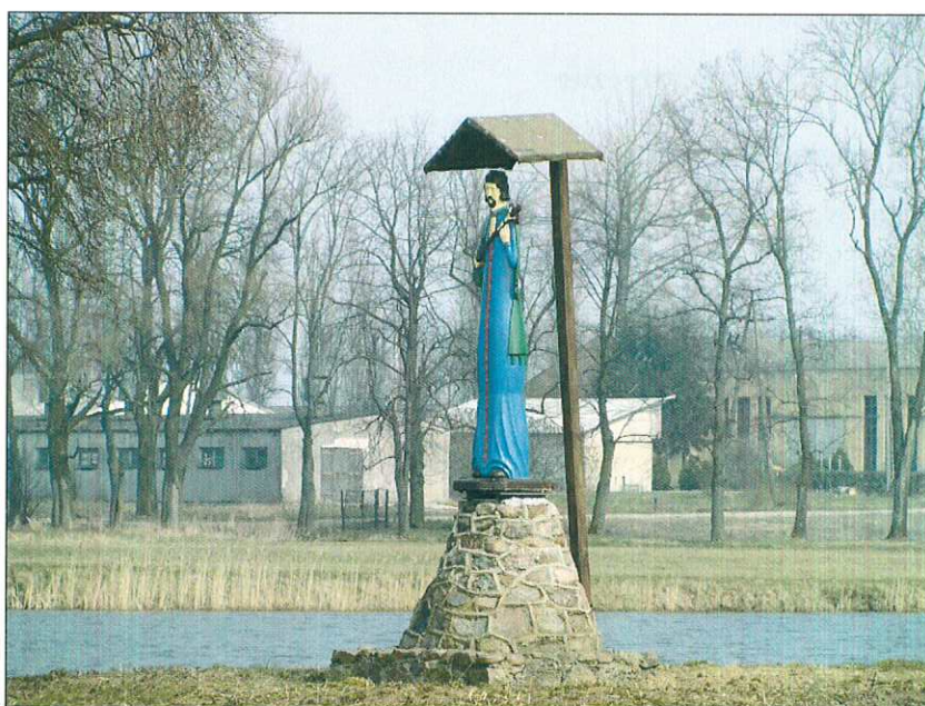
Rycina 2. Figurka Św. Jana Nepomucena.

Pałac w Nacpolsku jest murowany, otynkowany, na narożach boniowany. Należy do pałaców piętrowych z podpiwniczeniem. Na osi ryzalit zwieńczony jest trójkątnym szczytem. Wewnątrz układ dwutraktowy z sienią na osi.