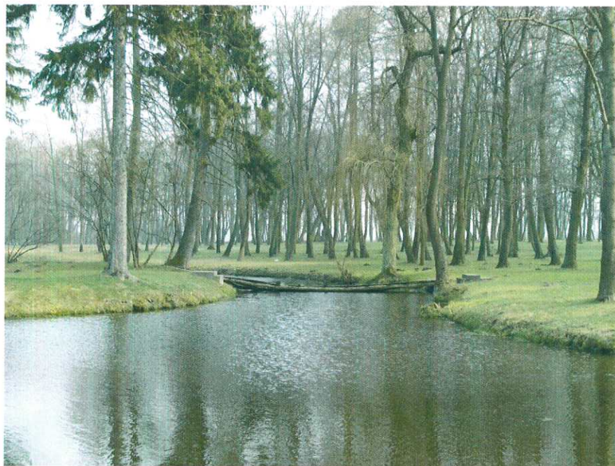
Rycina 4. Park podworski w miejscowości Nacpolsk.