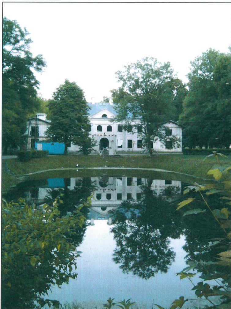
Rycina 3. Budynek dworu w Nacpolsku.