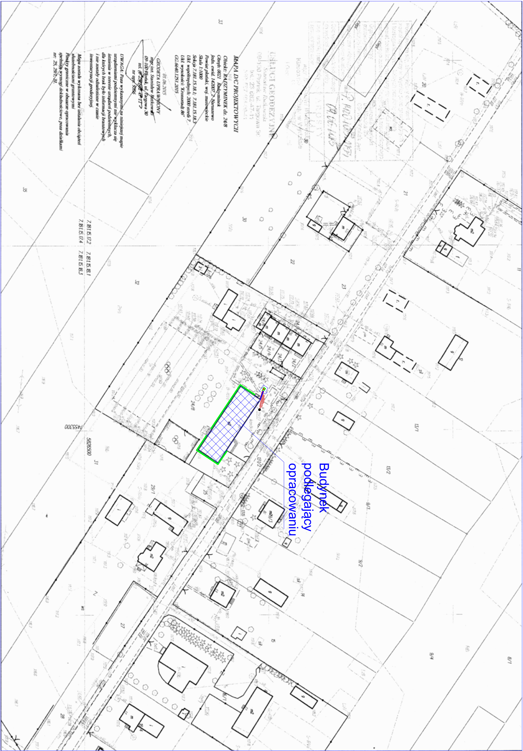
Wyniesienie skala 1:200